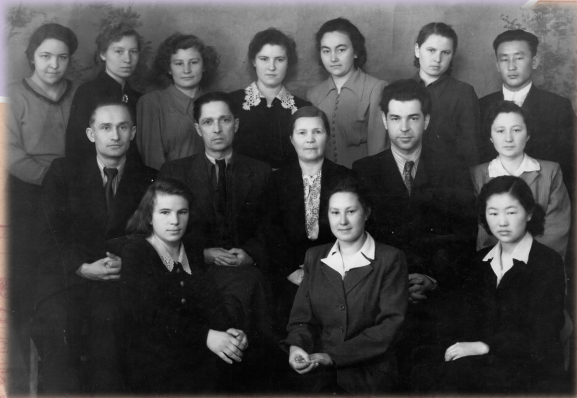
Преподаватели и студенты ЧГМИ 1954г.

Кадры профессорско-преподавательского состава были укомплектованы за счет реорганизованного Молотовского Медиститута и других медвузов гг. Ленинграда, Горького, Иркутска, Ростова-на-Дону и др. В первый учебный год студенты занимались в 2 лекционных залах, и в лабораторных 9 кафедр. В учебном году 53/54 гг. посещаемость занятий была 97%, абсолютная успеваемость 97%, отличников 55%.