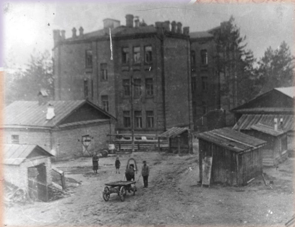
Областная больница им. Ленина 30-е гг.

До появления вуза вся теоретическая и практическая медицина в крае развивалась да и просто существовала за счет приезжавших в Забайкалье ученых и врачей. Ощущалась острая нехватка специалистов разных специальностей. Так в 1937г. в Чите вместо предусмотренных планом 176 врачей работали только 73, широко применялось совместительство. Нарастала необходимость кардинальных изменений.