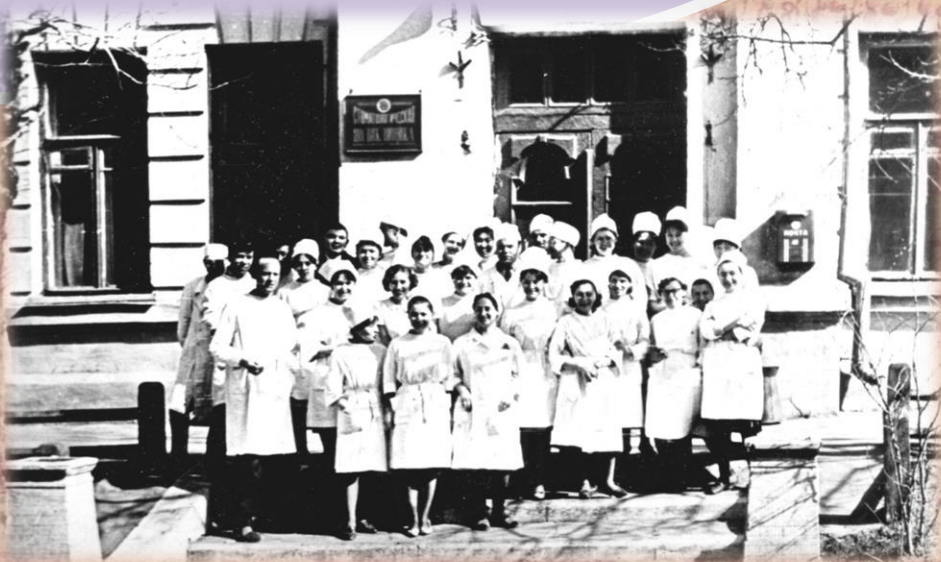
Студенты мединститута на крыльце главного корпуса 1956г.