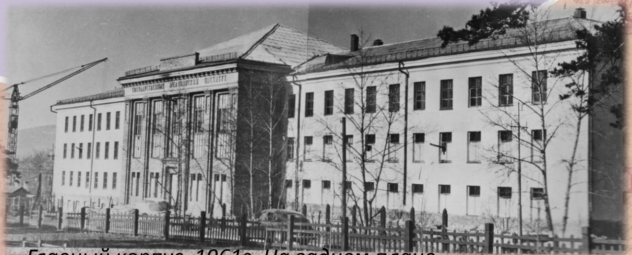
Главный корпус, 1961г. На заднем плане строительство общежития для студентов