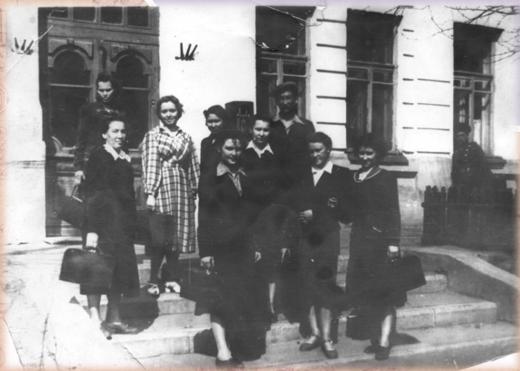
Студенты первого набора на крыльце главного корпуса ЧГМИ

Норма приема студентов на первый курс в 1953г. – 200 чел. В июле 1953г. было подано 733 заявлений на поступление. Допущено к экзаменам было 241 человек. С 1 августа начались вступительные экзамены. Сдавали физику, химию, русский язык и литературу.