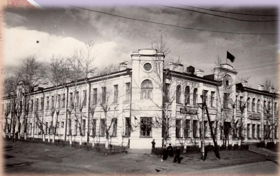
Главный корпус 1953г.