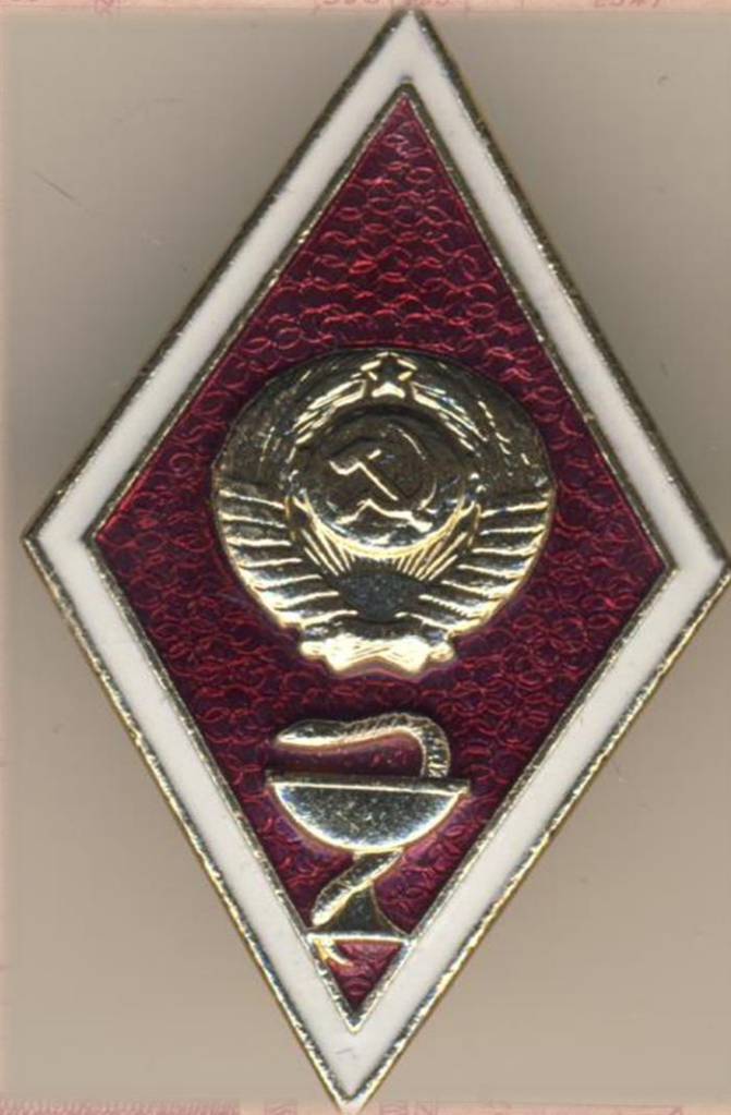
Нагрудный знак выпускника медицинского вуза СССР

В начале 20 века в Российской империи работало только 8 медицинских вузов. Сосредоточены они были в основном в европейской части страны. После революции 17г. в стране начинают выстраивать систему высшего медицинского образования, руководствуясь новыми принципами – прежде всего планомерное развитие медицинского образования по всей стране. В 20-30гг. открыто 24 вуза, причем все в удаленных от центральной части страны городах. Ясно виден государственный курс на приближение высшего медицинского образования к разным районам страны. В годы войны было открыто 4 вуза, 3 – в связи с эвакуацией институтов из центральной части страны в тыл. В 50-е годы развитие сети мединститутов продолжилась - в восточных регионах страны (Благовещенск, Кемерово, Барнаул, Владивосток, Чита) были открыты медицинские институты. Это стало завершающим этапом формирования системы высшего медицинского образования. К этому времени СССР выходит на перовое место по обеспеченности врачами.