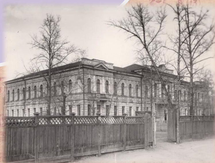
Корпус № 2 1953г.